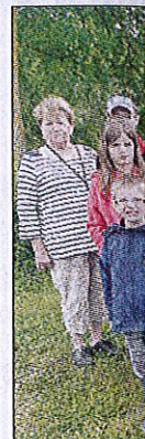
La matinée Boisseau